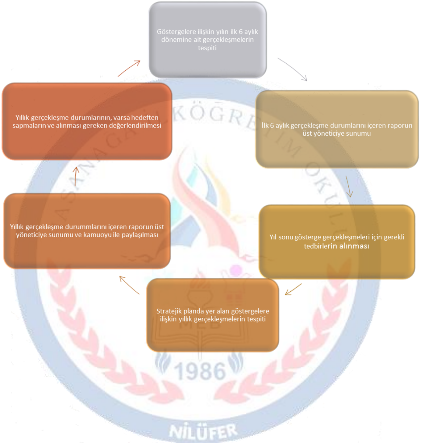
Şekil 2: İzleme ve Değerlendirme Modeli